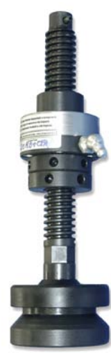
REGOLAZIONE E BLOCCAGGIO

Spinta del carico - utilizzo esclusivo in compressione.